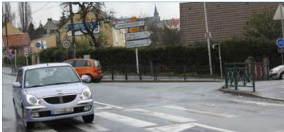
▲ Parmi les travaux programmés à Dammartin en partenariat avec le Conseil général de Seine-et-Marne, l'aménagement et la sécurisation de ce carrefour au niveau de la rue Louis Braille et du centre de secours.