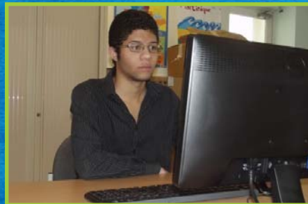
Découvrez l'espace numérique du Centre social et culturel en page 6.