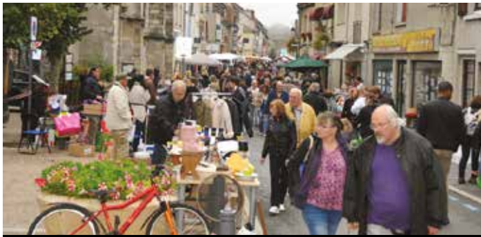
Le 13 septembre, brocante organisée par le comité des fêtes.