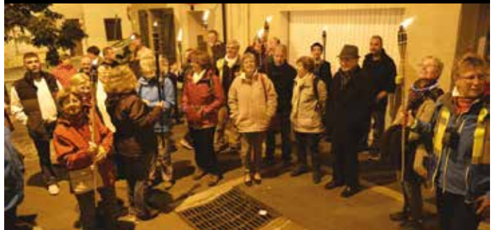
... puis rando nocturne et médiévale avec Goële rando, suivie d'une soupe.