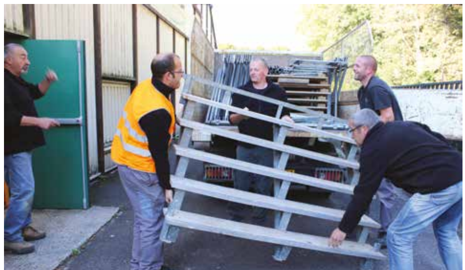
Installation de la scène et transformation du gymnase pour le festival intercommunal des anciens.

Cette équipe de « gros bras » est un mélange d'agents de la voirie, des espaces verts et des bâtiments. C'est elle qui transforme quelques bouts de bois en une tranchée militaire de 1914 ou qui métamorphose un gymnase en une salle de cérémonie.