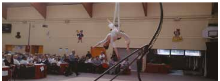
Le 4 octobre au gymnase Maurice Lerozier, près de 600 convives au Festival intercommunal des anciens sur le thème du cirque.