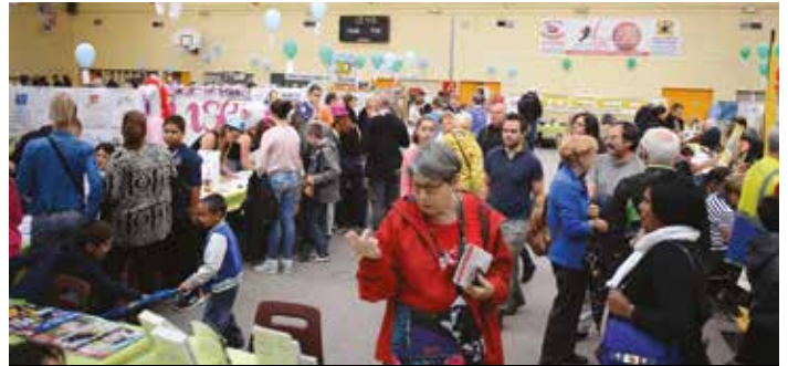
Le 12 septembre, forum des associations au gymnase Maurice Lerozier.