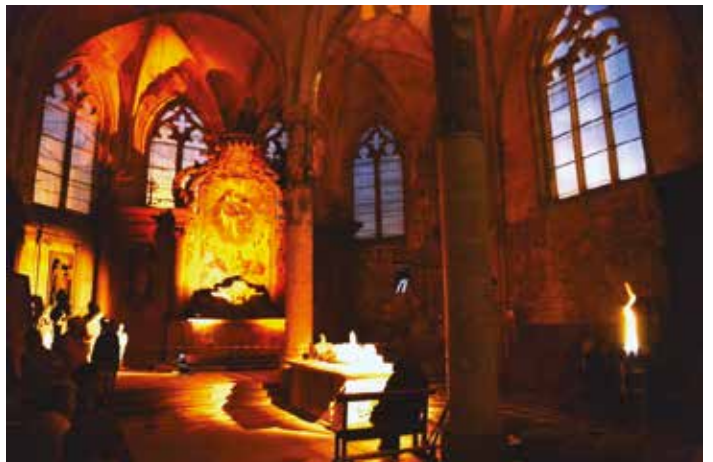
Le 19 septembre, journées européennes du patrimoine avec illuminations intérieures de la Collégiale...