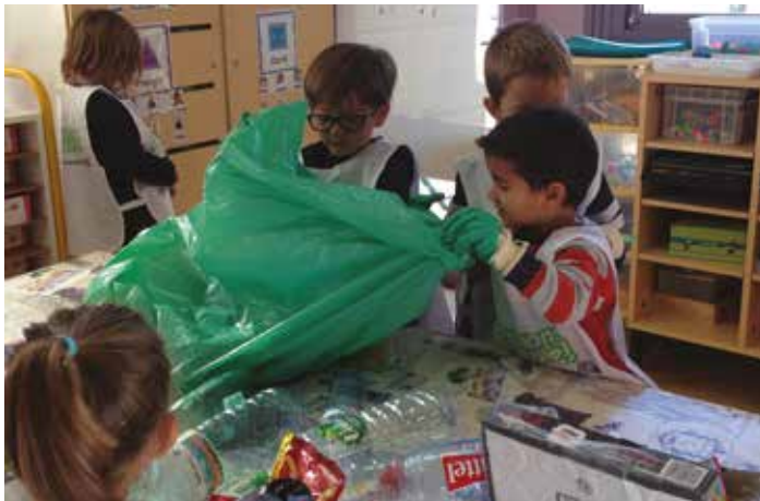
Opération Nettoyons la nature avec les grandes sections de l'école Henry Dunant, vendredi 25 septembre. Le lendemain, ce sont les adultes qui ont œuvré autour de la mare à salé.