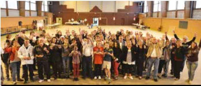
Le 6 septembre, la ville a organisé une journée dédiée aux associations pour proposer au public des démonstrations et initiations. En soirée a eu lieu une remise de trophées aux bénévoles et sportifs méritants.