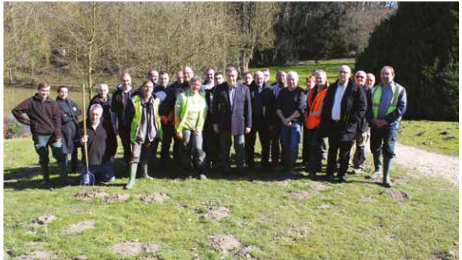
Mi-février, tous les agents du Centre technique municipal ont remis en état le parc de la Corbie.

Petits tours d'horizon de ces femmes et hommes au gilet fluo.