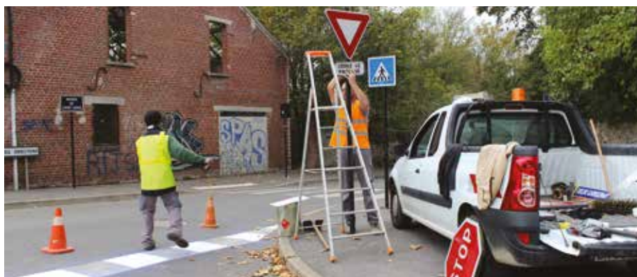
A l'automne dernier, transformation de la signalétique devant le parc de la Corbie.