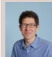
Retrouvez l'intégralité de cette tribune ainsi que l'audit du cabinet RSA-Crowe Gloabl, sur notre site : www.vivredammartin.fr

Toute l'équipe de Vivre Dammartin vous souhaite une bonne rentrée scolaire 2019.