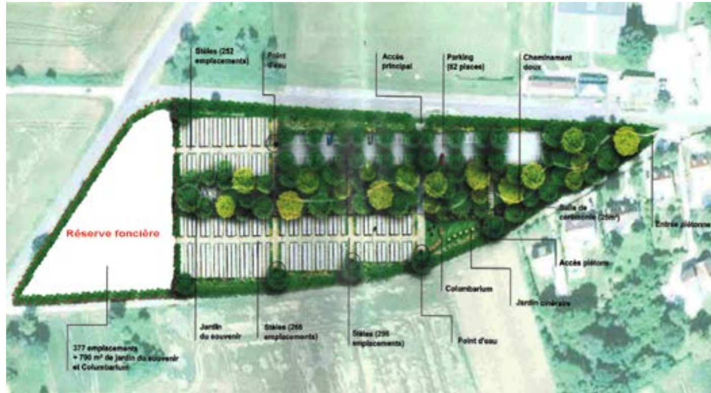
Plan du futur cimetière paysagé

En ce début d'année 2019, c'est avec grand plaisir que nous allons observer la mise en travaux relative à l'aménagement du 2ème cimetière et son parking.