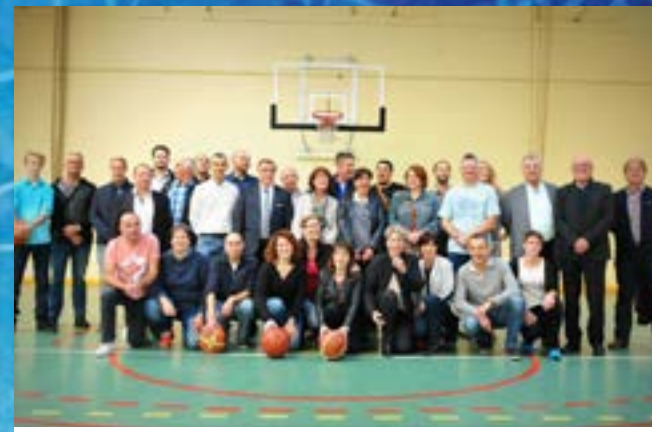
Fête de l'ABC Dammartin pour le baptême du gymnase.