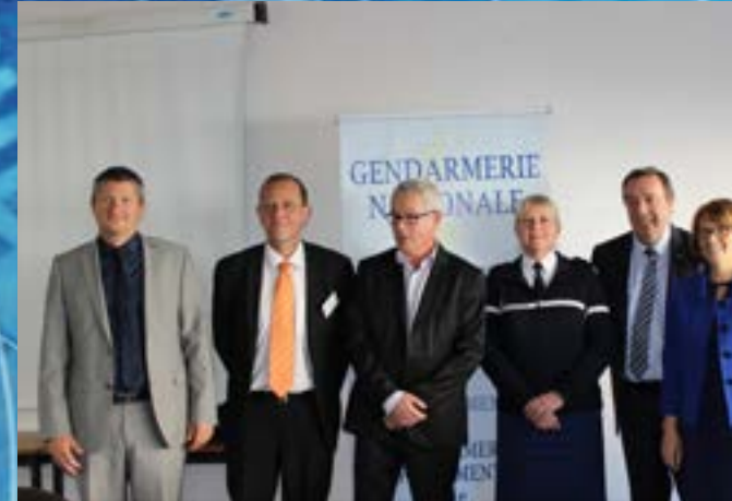
Témoignage aux Maires de Seine-et-Marne sur la gestion de crise