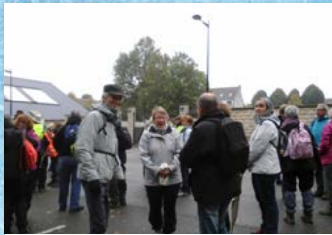
Départ de la randonnée conviviale et attractive avec la participation de Goële-Rando dans le cadre de la «semaine bleue»