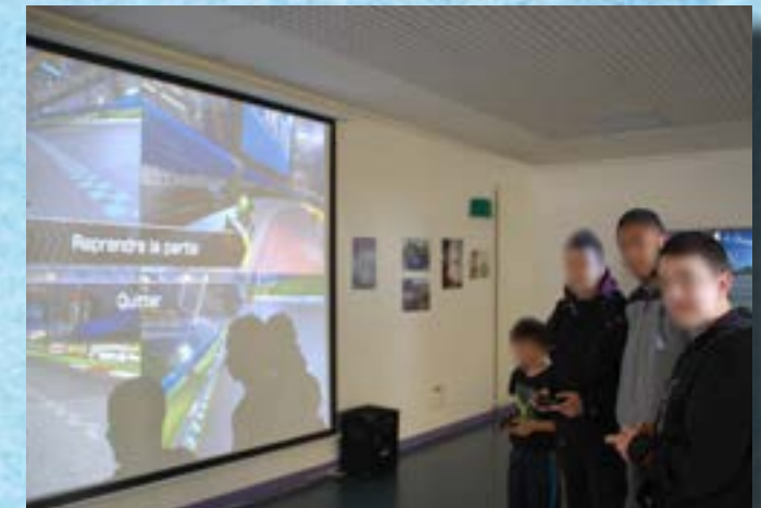
1er salon du jeu vidéo, grand succès auprès des jeunes, rendez-vous l'année prochaine