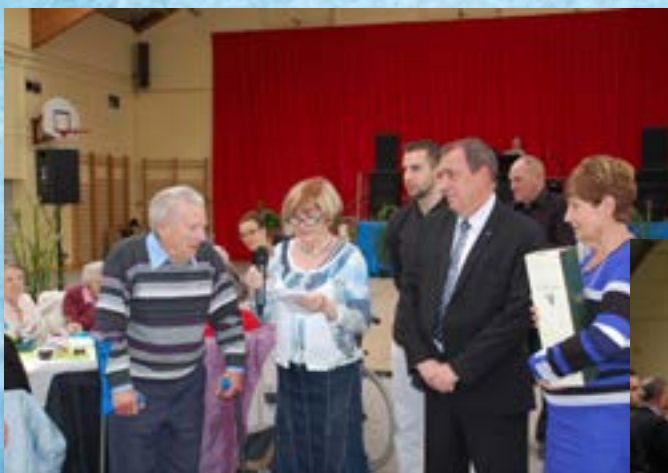
Nos doyens sont à l'honneur à l'occasion du repas des anciens