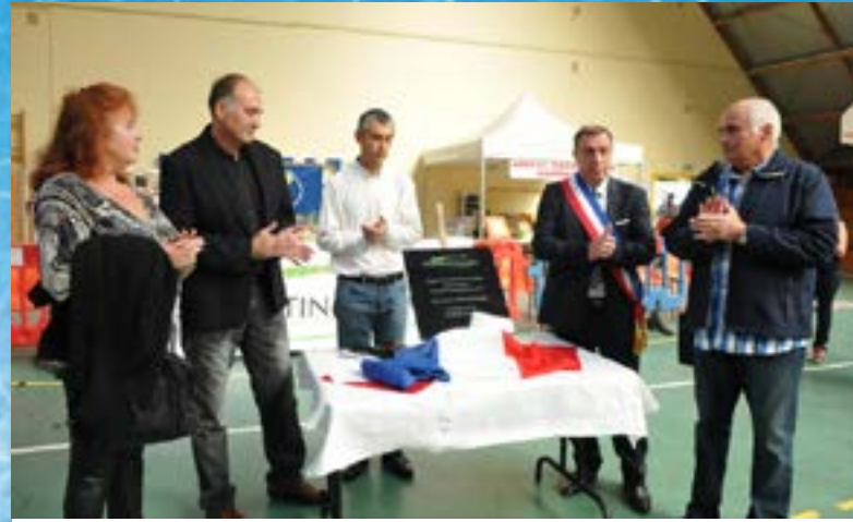
Baptême du Gymnase Maurice Lerozier