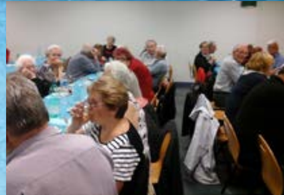
Thé dansant avec la participation de l'Age d'Or dans le cadre de la «semaine bleue»