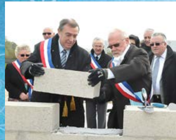
Pose de la première pierre de la nouvelle station d'épuration à Dammartin-en-Goële le Samedi 14 novembre