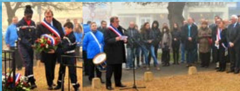
1er salon du jeu vidéo, grand succès auprès des jeunes, rendez-vous l'année prochaine