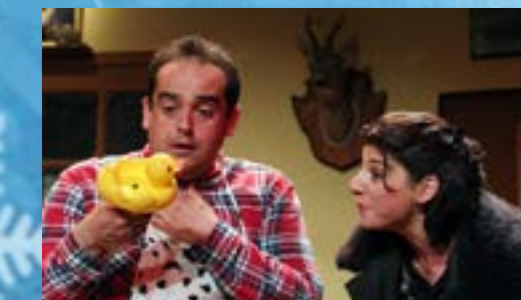
Vif succès pour la pièce de théâtre «Sexe, Arnaque et Tartiflette» organisée par le service culturel de la ville